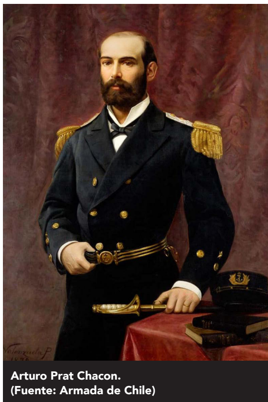
Arturo Prat Chacón.

Las Bases Curriculares de Historia, Geografía y Ciencias Sociales estructuran el aprendizaje escolar en torno a Objetivos de Aprendizaje que integran conocimientos, habilidades y actitudes. En este marco, la enseñanza de la historia cumple una