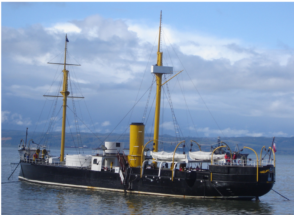
El Huascar fondeado frente a la base naval de Talcahuano.

La figura de Arturo Prat Chacón ha sido tradicionalmente interpretada como el arquetipo del héroe sacrificial. No obstante, una lectura más profunda de su trayectoria permite reconocer en él un modelo de virtud profesional estrechamente vinculado al proyecto republicano chileno.