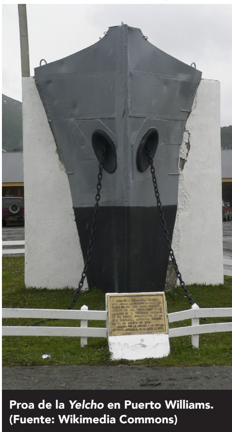
Proa de la Yelcho en Puerto Williams.