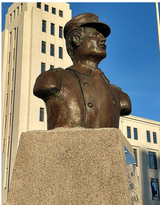
Busto en homenaje al marino chileno Luis Pardo Villalón en el Muelle Prat de Valparaíso.

Una omisión particularmente relevante es la escasa referencia a