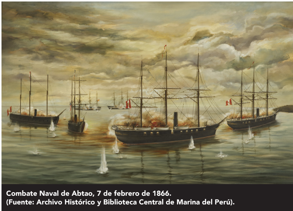
Combate Naval de Abtao, 7 de febrero de 1866.